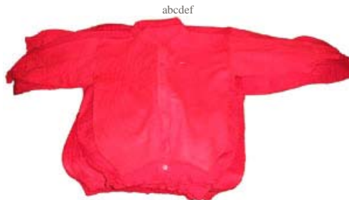
Presentación del producto terminado.