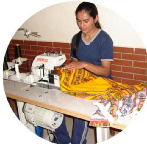
El taller cuenta con maquinaria Actualizada