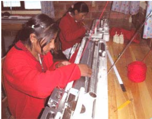
Participantes del taller, haciendo uso de la maquinaria en sus tejidos.