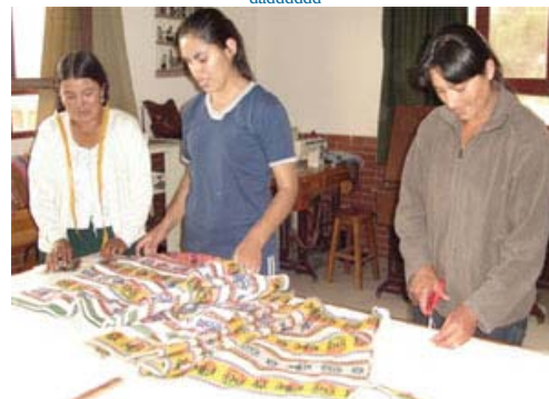
Integrantes de la microempresa, realizando el corte de la tela