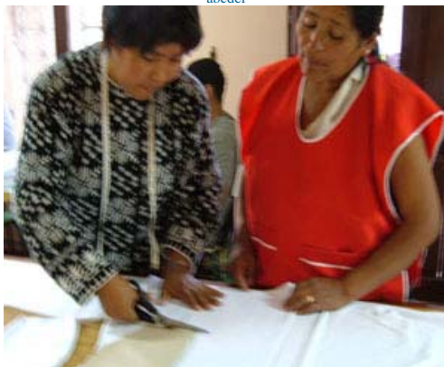
La facilitadora, instruyendo sobre La forma del corte de la tela