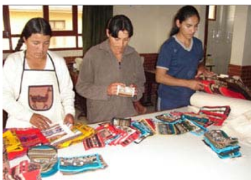
Verificación del control de calidad