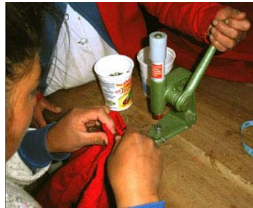
Realizando el prensado de los botones