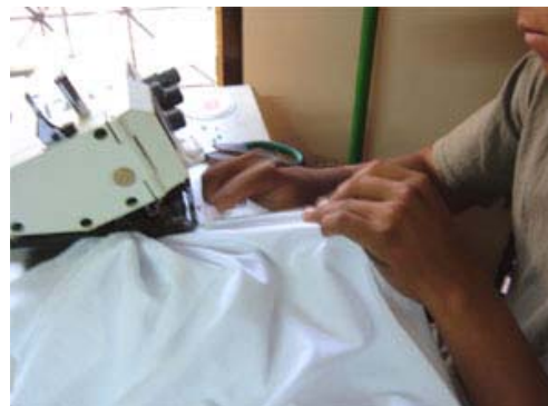
El taller cuenta con maquinaria Actualizada

La microempresa esta conformada por egresadas y egresados del Centro y una de las facilitadoras de la especialidad de Corte y Confección.