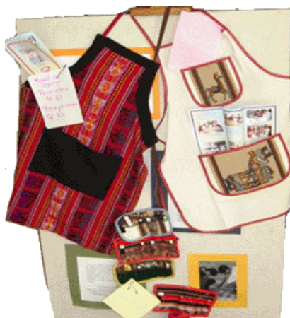
Exposición de mandiles con motivos artesanales