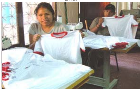
Presentación del producto terminado.