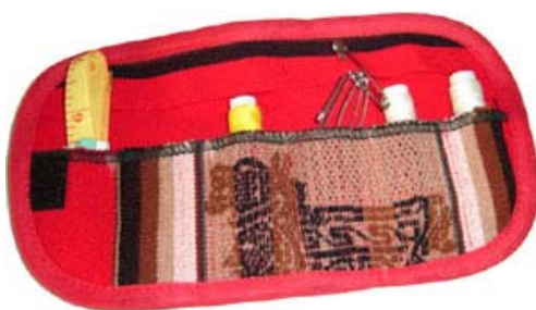
Producto Final: Porta costurero concluido